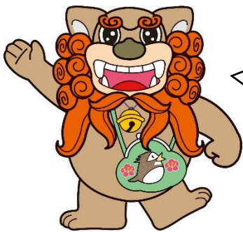
府中市マスコットキャラクター ふちこま

※新型コロナウイルス感染拡大防止のため、マスクの着用をお願いいたします。 ※今後の感染状況により中止する場合がございます。